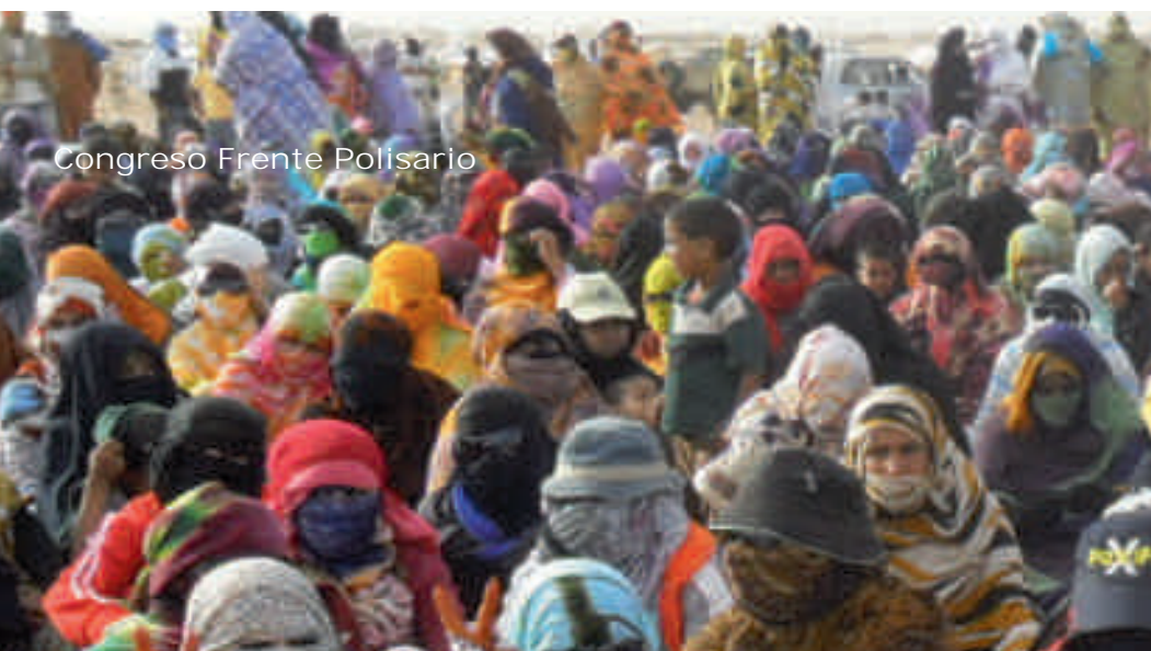
Congreso Frente Polisario

La nueva sede se encuentra ubicada en el corazón del Casco Viejo, en la Plaza de Navarrería 27. La oficina es amplia y ofrece bastantes posibilidades, desde un par de puestos de trabajo hasta una sala de reunión para juntarnos con nuestras socias. Este cambio creemos que aumenta nuestra visibilidad, y nos permitirá llevar a cabo diferentes líneas de trabajo conjunto con OCSI y otros colectivos que estén dispuestos a combatir la crisis de forma conjunta y solidaria.