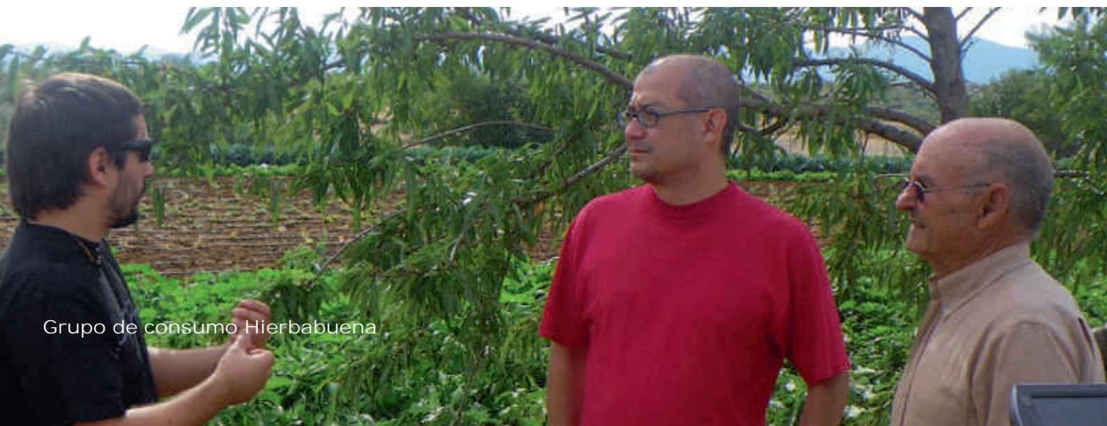
Grupo de consumo Hierbabuena