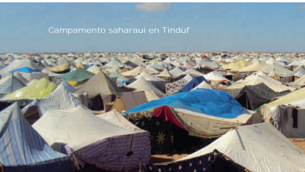
Campamento saharauí en Tinduf