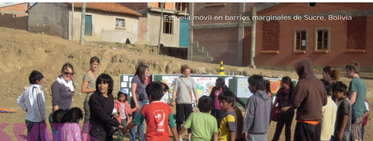
Escuela móvil en barrios marginales de Sucre, Bolivia

A lo largo de esos cuatro años de colaboración entre la Junta de Castilla La Mancha (JCCM), SODEPAZ e IPTK, se ha sistematizado la larga experiencia de trabajo y se ha estructurado adecuadamente el contenido curricular de todos los talleres, elaborándose finalmente las guías docentes para mejorar la calidad del trabajo, reflexionar críticamente sobre los aspectos pedagógicos, psicológicos y de contexto, permitiendo una formación cualificada, y de acuerdo a la situación socio económico de los/as beneficiarios/as. Asimismo, con el afán de trabajar para la auto-sostenibilidad del CERPI, se ha