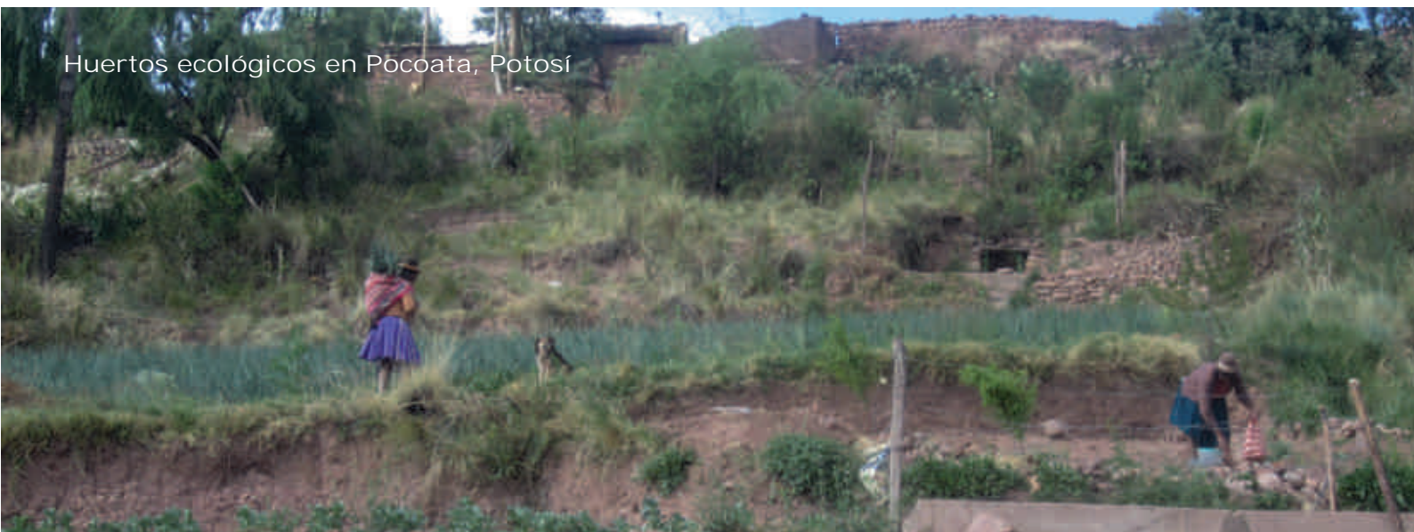
Huertos ecológicos en Pocoata, Potosí

Nos gustaría poder realizar seguimientos en el terreno más duraderos y con más frecuencia, y de esta manera acompañar más la labor de nuestras contrapartes, técnicos, beneficiarios/as y dirigentes. Nos gustaría también vivir de primera mano las dudas, dificultades, éxitos, y debates ligados a los procesos políticos vividos en el país y/o con los proyectos en los cuales nos hemos involucrados estos últimos años, pero la burocracia en la que nos vemos cada vez más sobrepasados/as no nos lo permite. Por esta razón, el viaje de seguimiento de noviembre a Bolivia y Perú tienen tanta importancia. Esos viajes de seguimiento aunque cortos se hacen sumamente importantes.