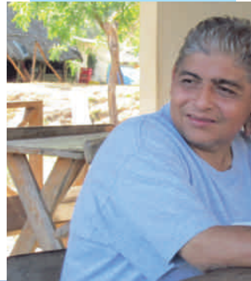
Hospital de Tifariti